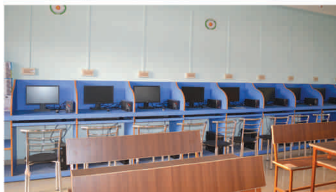
A view of Geographical Information System (GIS) Laboratory