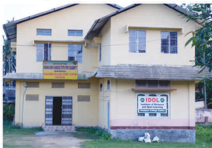
KKHSOU and IDOL- the two ODL study centres of college are housed in the same building