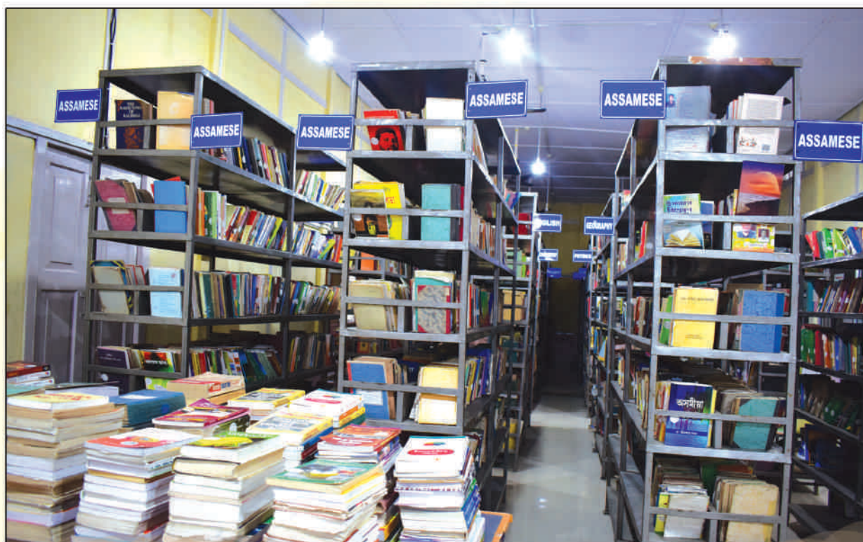
A view of College Library