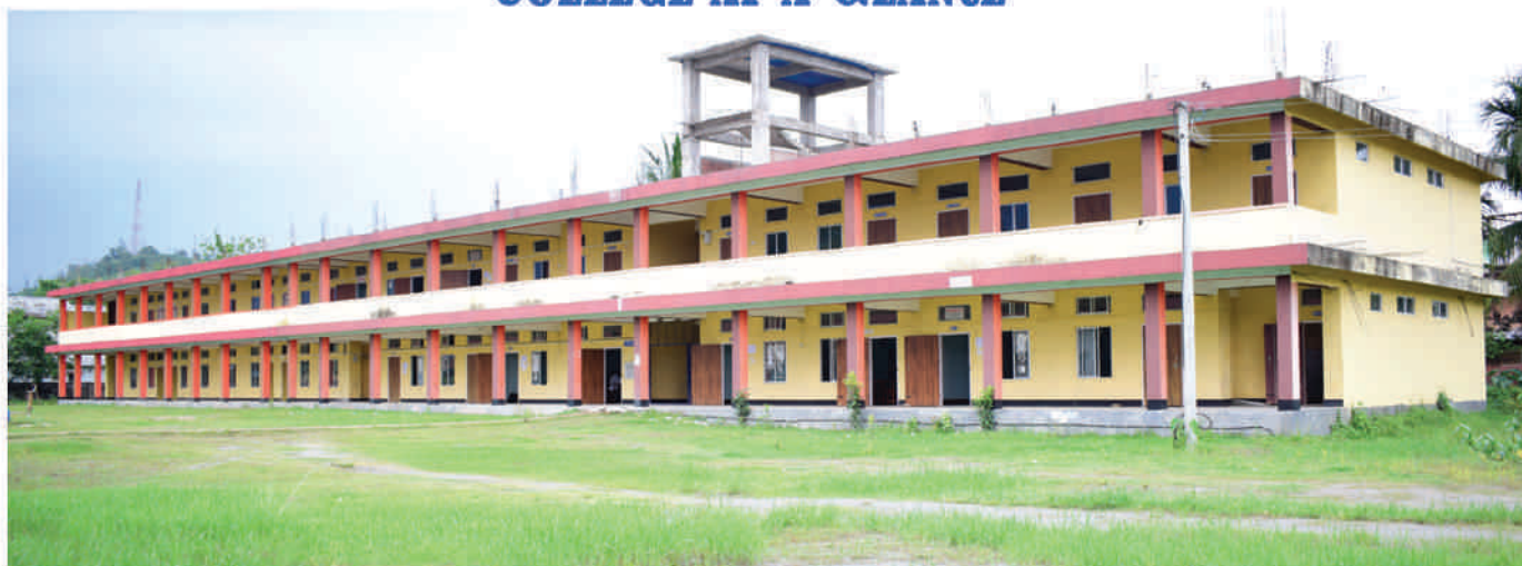
New Academic Building