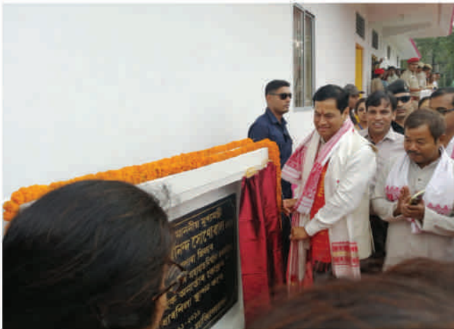
Foundation stone laying ceremony of Community Radio Station at Goalpara College by Honourable Chief Minister of Assam on November 20, 2019