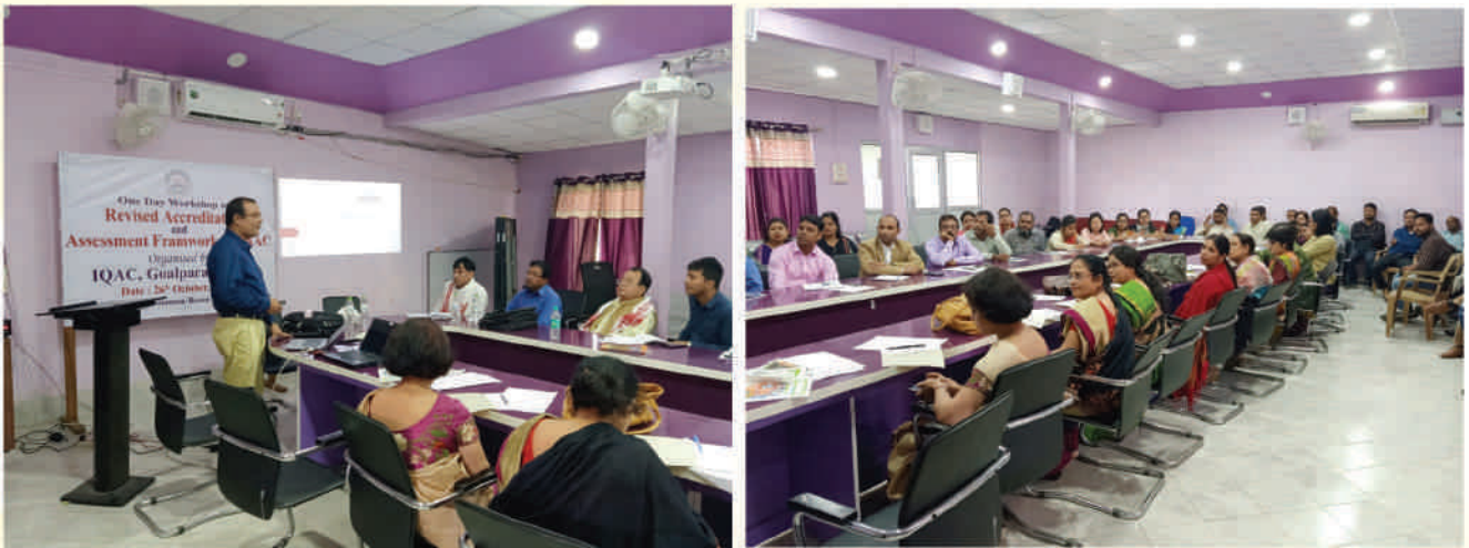
One day Workshop on Revised Accreditation and Assessment Framework on NAAC organised by IQAC, Goalpara College