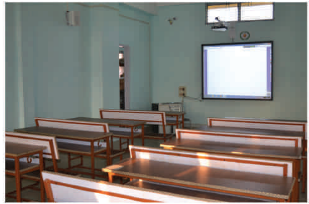
Smart Class Room