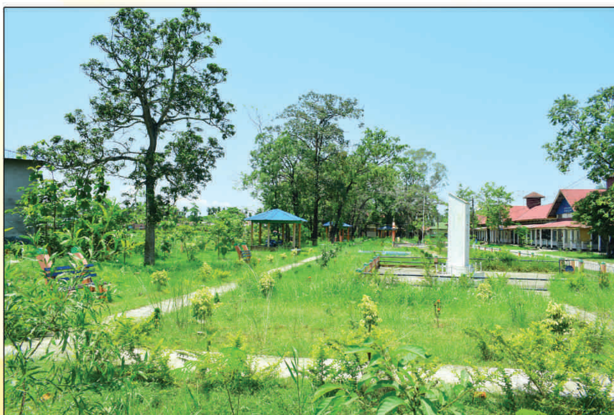
A view of College garden