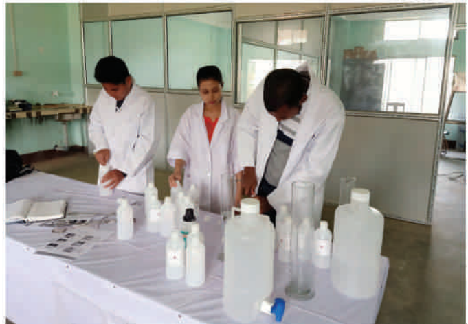
Faculty members of Department of Botany with Sanitiser bottles prepared in the newly constructed laboratory to fight the COVID-19 pandemic.