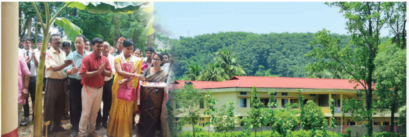
Inauguration of New Girls' Hostel by Varnali Deka, IAS, Deputy Commissioner, Goalpara