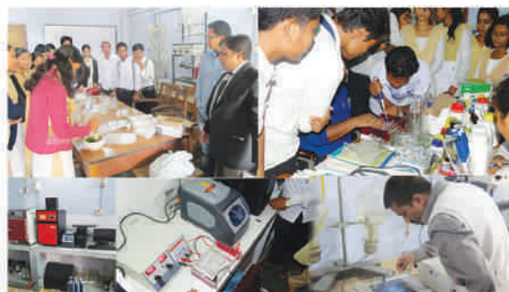
Department of Biotechnology (DBT) Govt. of India Sponsored Bio-Tech Hub

Goalpara College, Goalpara launched a Biotech Hub Centre at Department of Botany with financial grant provided by Department of Biotechnology (DBT), Government of India in 2010 and has completed six successful years. The main aim of this scheme is to provide modern facilities to the undergraduate students especially in the field of Molecular Biology along with upgraded laboratories. Apart from upgrading the existing labs we have a full-fledged Molecular Biology lab with uninterrupted power supply. Under Biotech Hub scheme, we organize various programmes every year e.g. three-day-seminar, workshop, industrial visits, field excursions for students. We have published a number of research papers. A practical manual entitled Practica manual in Biological Sciences has been published for the students. We encourage students from all disciplines to avail the facilities of this scheme to carry on their research projects.