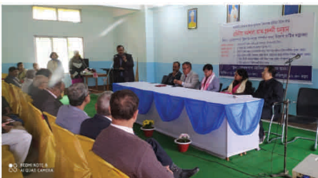
One-Day Workshop cum Exhibition on Employment generation through Indigenous resources in Goalpara district organised jointly by Department of Economics and Geography