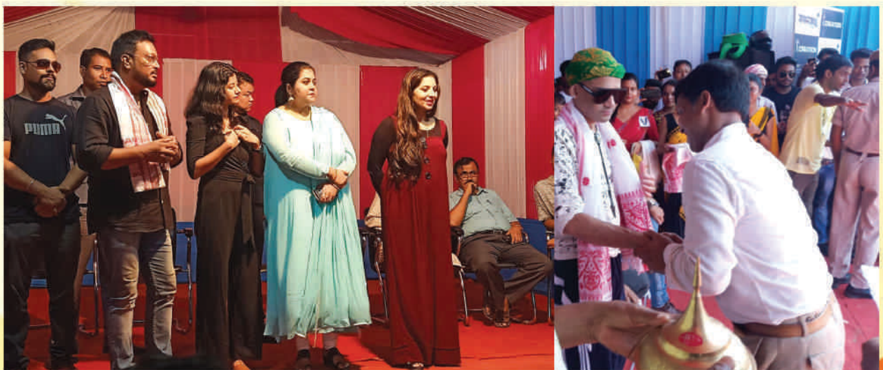
Assam's Heartthrob Zubin Garg and Actor Jatin Bora at Goalpara College in two different occasions.